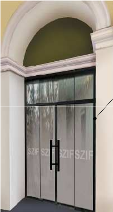
NOVÉ VSTUPNÍ DVEŘE